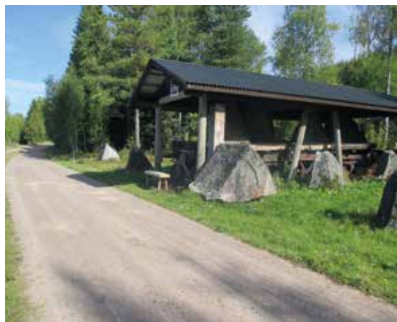
Spärrvagnen i Torgåsmon vid Skans 206.