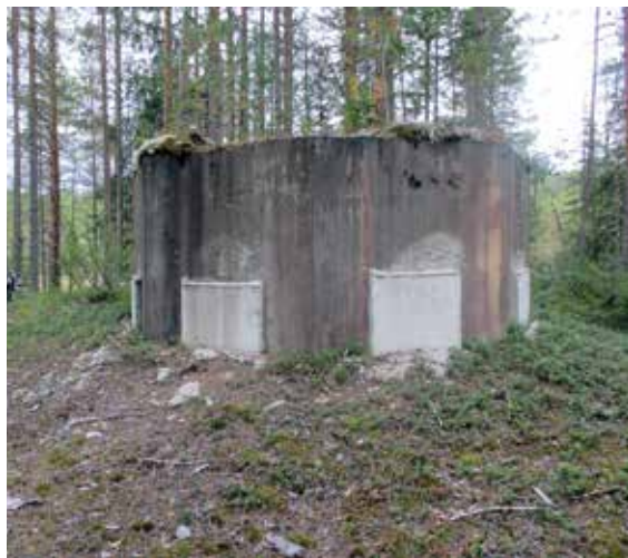
Ett av Skans 212 båda bevarade Kg-värn.