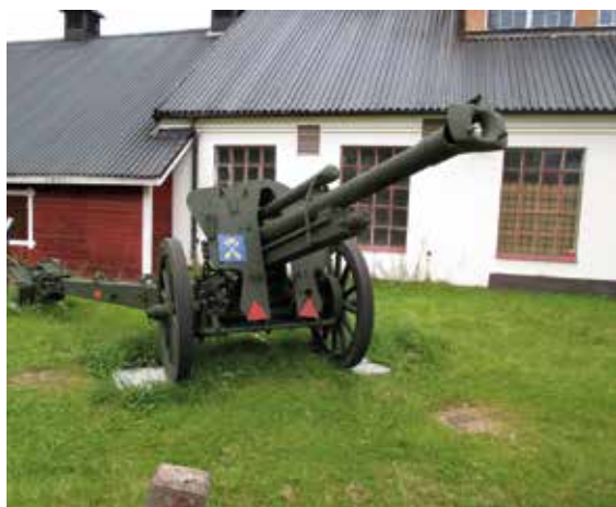
Museet på Rommehed.