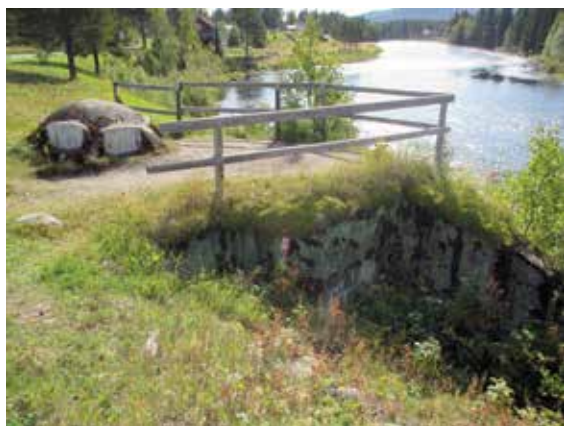
Ett av skans 203 kulsprutevärn invid Dalälven.