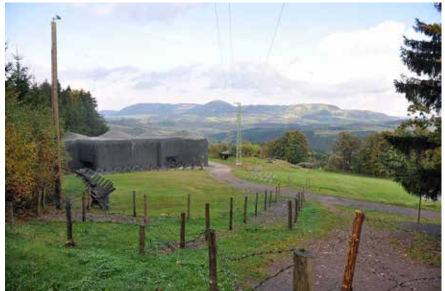
En del av den tjeckiska befästningslinjen vid staden Nachod.

Många av de "stora" befästningarna är välkända, och till och med berömda. Kinesiska muren är väl kanske den som står högst upp på listan över befästningar, men den tänkte vi lämna till andra att skriva om. Däremot kommer både Maginotlinjen, Västvallen, Atlantvallen och flera andra stora befästningslinjer att skärskådas. Men man skall komma ihåg att före dessa stora befästningslinjers tid var det ofta enskilda befästningar som gällde. Ibland placerade runt försvarsobjekt, som ofta var en viktig stad. Som exempel kan nämnas Verdun, Paris och flera andra städer. Här hemma finns Bodens fästning och även Värmdöplatåns befästningar för-