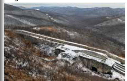
Fort No. 3. norr om Vladivostok. Ett gevärsgalleri (öppet) med skyddsrum observatörer.

Naturligvis är detta ett gigantiskt ämne och i vissa fall en hel vetenskap av olika försvarsprinciper och skolor. FORT & BUNKER kommer därför också att ha en sida om Fortifikationslära i kommande nummer. Vad är fortifikation och har det alltid sett likadant ut? Något som du inte får missa!