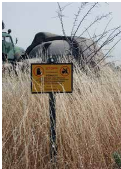
Foto taget i samband med avvecklingen av ett KA-batteri. Bilden tagen med tillstånd.

Projektet är beräknat att börja fullt ut under 2022 och skall förhoppningsvis ge oss svaret på frågorna kring vad som driver denna grupp.