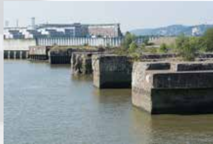
Hamburg, Fink II.